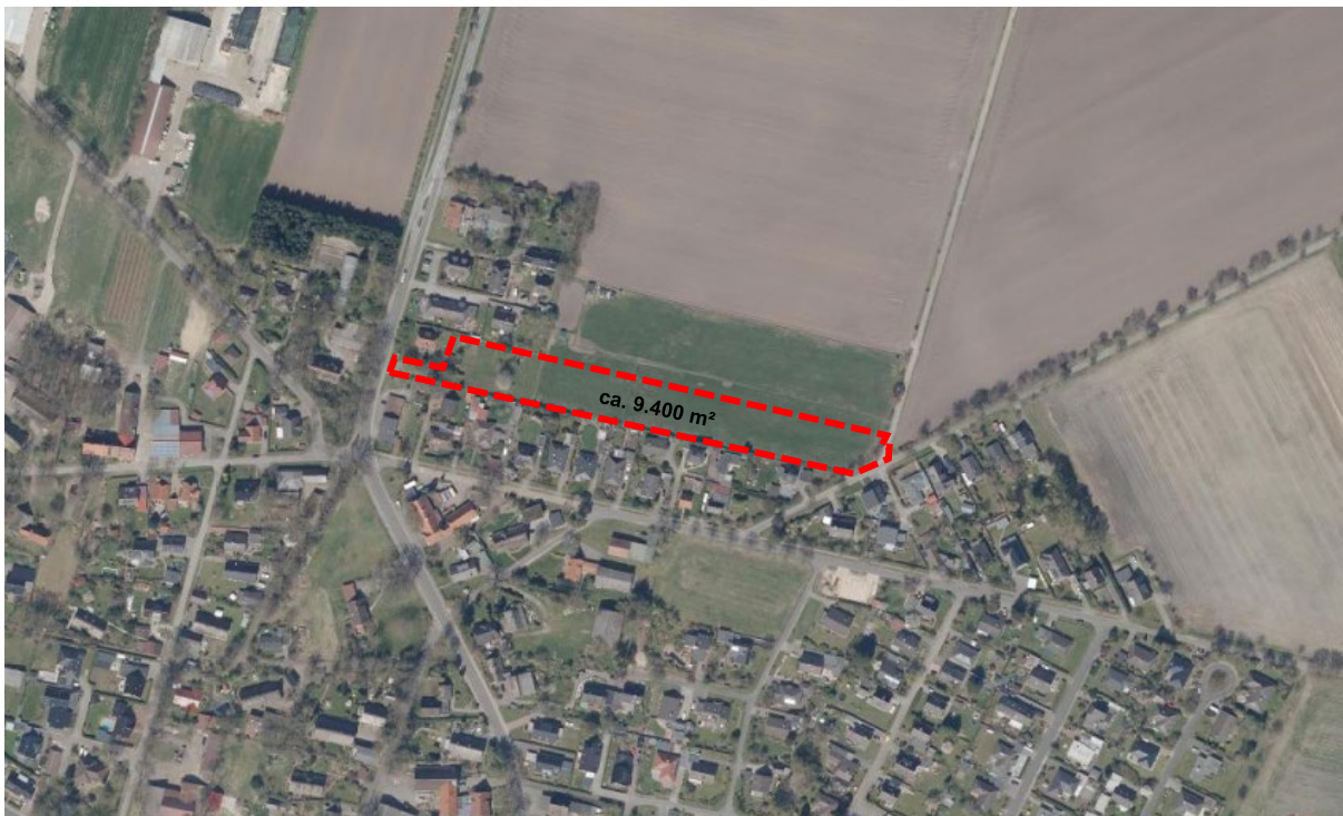
Abbildung 2: Luftbild mit Abgrenzung (rot) des Plangebietes (o. M.)

Das Plangebiet wird derzeit als Grünfläche genutzt. Im Osten grenzen einerseits landwirtschaftliche Flächen nördlich der Straße „Am Steinacker“ und andererseits Wohnbebauung südlich dieser Straße an das Plangebiet an. Nördlich grenzt das Gebiet an eine Grünfläche, welche als Weidefläche genutzt wird. Der südlich und westlich angrenzende Bereich ist durch ländliche Wohnbebauung mit überwiegend Einzelhäusern und mit zugehörigen privaten Gartenflächen geprägt.