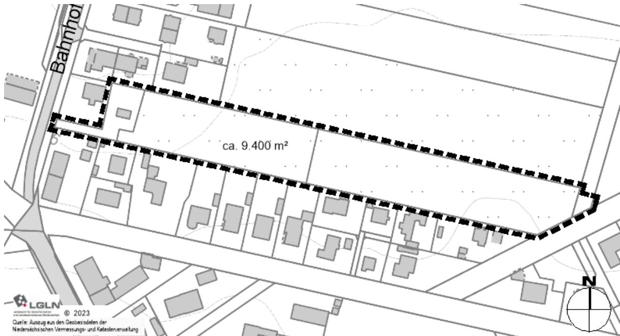
Abbildung 1: Geltungsbereich des Bebauungsplans (o. M.); © LGLN, Bearbeitung eigene Darstellung