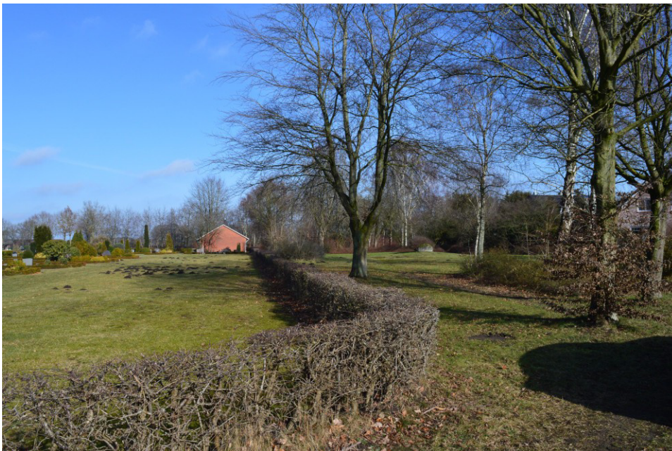
Blick von Süden: links der Hecke = Friedhof, recht der Hecke = Plangebiet

Durch den Bebauungsplan Nr. 7 „Am Friedhof“ (Stand Januar 2023) wird eine bisher als Grünanlage angelegte und gepflegte Fläche überplant (siehe Bild = rechts der Hecke). Ein Großteil des Plangebietes wird als Scherrasen intensiv gemäht. In einigen Bereichen sind Beete, überwiegend aus Ziersträuchern ( Amelanchier lamarckii , Symphoricarpos chenaultii , Rosa rugosa ) vorhanden. Zusätzlich stehen in den Beeten bzw. auf den Rasenflächen zahlreiche Bäume.