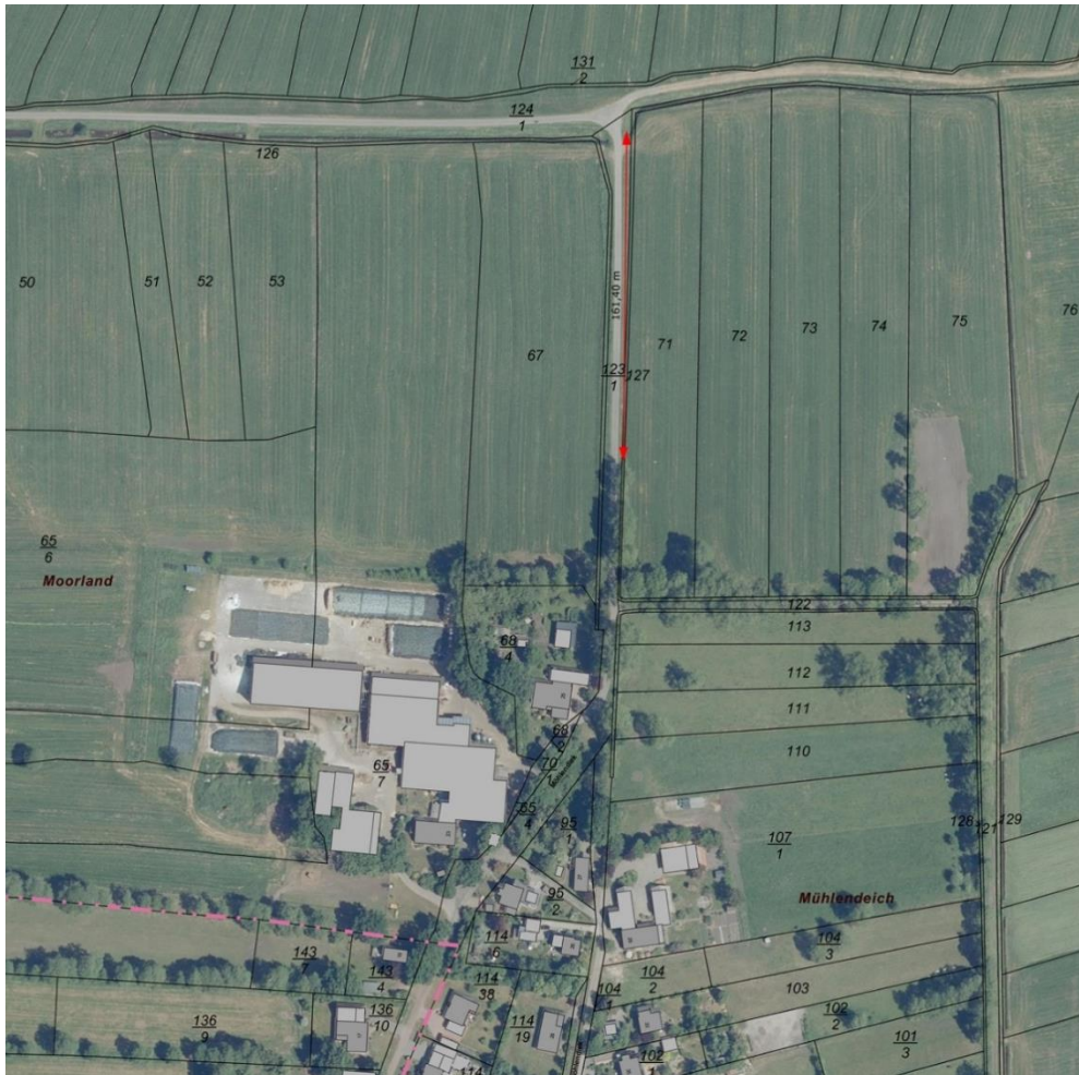
Kennzeichnung der vorgesehenen externen Kompensationsfläche (ohne Maßstab); Quelle: LGLN, eigene Darstellung