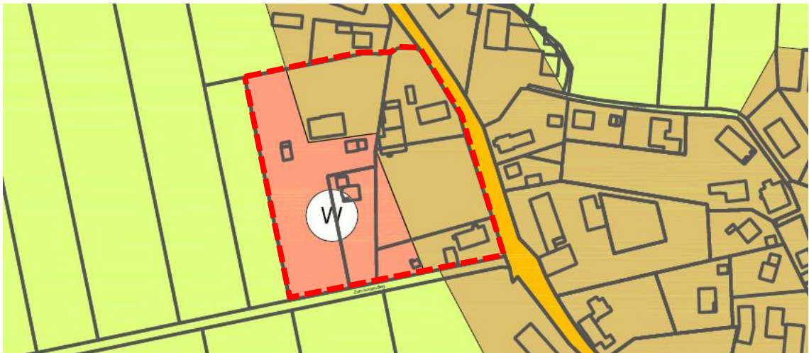
Abb.: Auszug des Flächennutzungsplans mit Kennzeichnung des Satzungsgebietes (ohne Maßstab)

Die geordnete städtebauliche Entwicklung des Gemeindegebietes wird durch die Planung nicht beeinträchtigt, da die Darstellungen des Flächennutzungsplans der Planung nicht entgegenstehen.