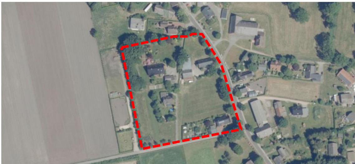
Abb.: Luftbild mit Kennzeichnung des Satzungsgebietes (ohne Maßstab); Quelle: NIBIS-Kartenserver, eigene Darstellung

Nach Westen hin zum offenen Landschaftsraum ist das Gebiet bereits dicht eingegrünt. Südlich und westlich schließen sich landwirtschaftliche Flächen an.