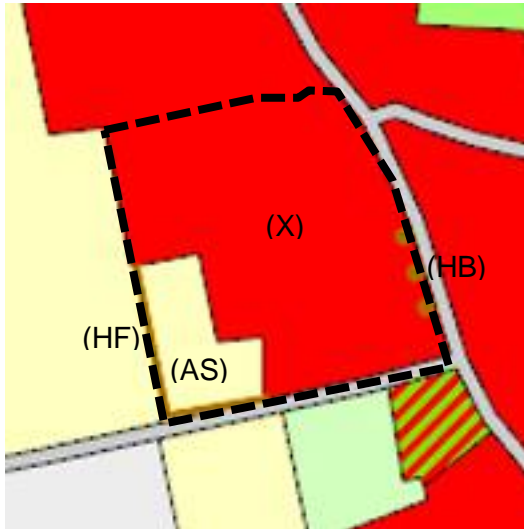
Auszug aus der Biotoptypen- und Realnutzungskartierung mit Kennzeichnung des Satzungsgebietes (ohne Maßstab); Quelle: Kartenserver Landkreis Stade, eigene Darstellung

Innerhalb des Plangebietes befinden sich Gehölzbestände, die eine unterschiedliche Wertigkeit aufweisen. Folgende Gehölzstrukturen sind insbesondere zu beachten: