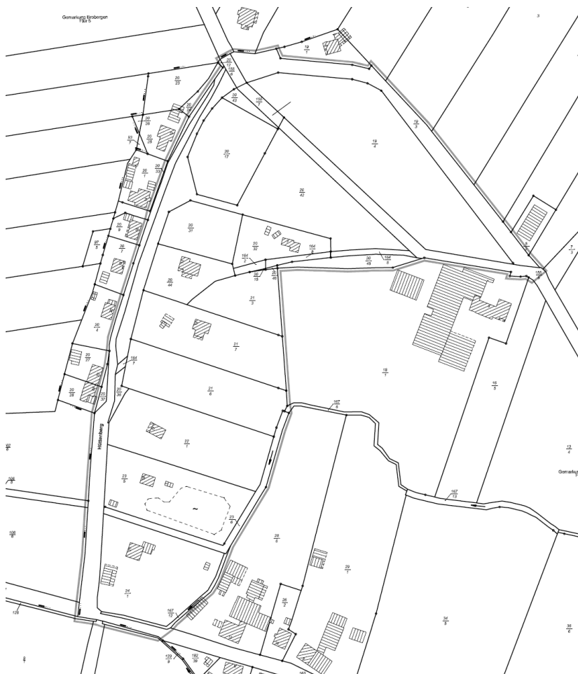
Abb.: Geltungsbereich des Bebauungsplans (ohne Maßstab)

Der Rat der Gemeinde Kranenburg hat die Aufstellung dieser 1. Änderung des Bebauungsplanes Nr. 1 „Am Hüttenberg“ beschlossen. Der Bebauungsplan wird im beschleunigten Verfahren gemäß § 13a BauGB aufgestellt.