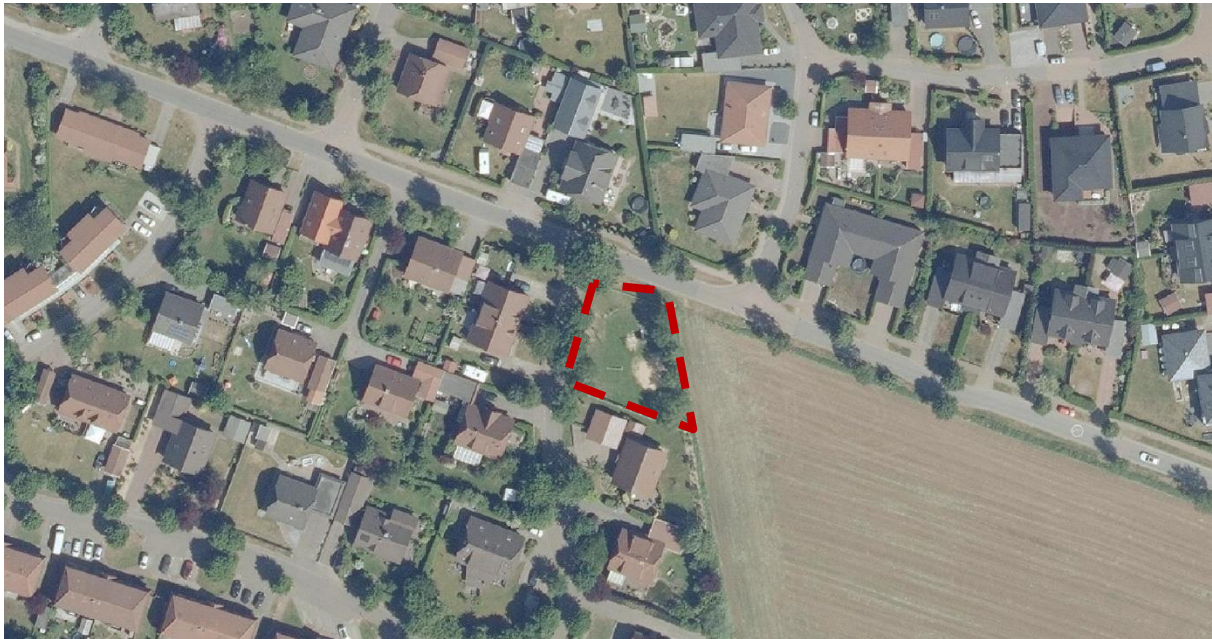
Abbildung 2: Luftbild mit Abgrenzung (rot) des Plangebietes (o. M.); Quelle: © LGLN, eigene Darstellung

Das Plangebiet liegt südwestlich des Wohngebietes „Sandheide“, nordöstlich der vorhandenen Bebauung an der Straße „Im Ring“ am südwestlichen Rand des Siedlungsgefüges von Hammah.