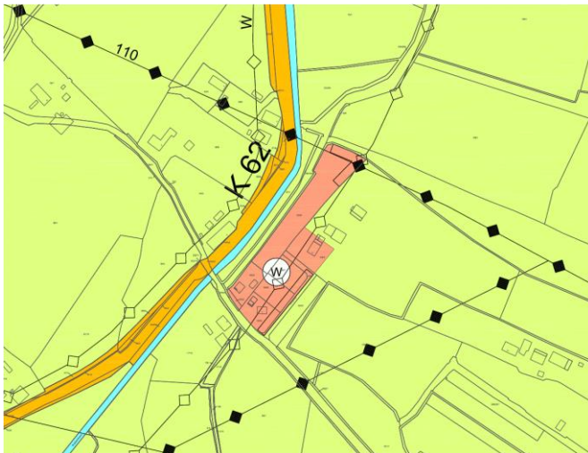
Abb.: Ausschnitt aus dem Flächennutzungsplan der ehemaligen Samtgemeinde Himmelpforten (ohne Maßstab)

Für den Geltungsbereich des Plangebiets sind Wohnbauflächen dargestellt. Die Planung orientiert sich an den Darstellungen des Flächennutzungsplans. Es wird ein allgemeines Wohngebiet festgesetzt. Eine im Rahmen der Anwendung des § 13b BauGB mögliche Berichtigung des Flächennutzungsplans ist nicht erforderlich, da kein Widerspruch zu den Darstellungen besteht. Die mit dem Flächennutzungsplan vorbereitete, geordnete städtebauliche Entwicklung bleibt gewährleistet.